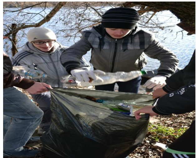
Участие в акции «Чистый берег»