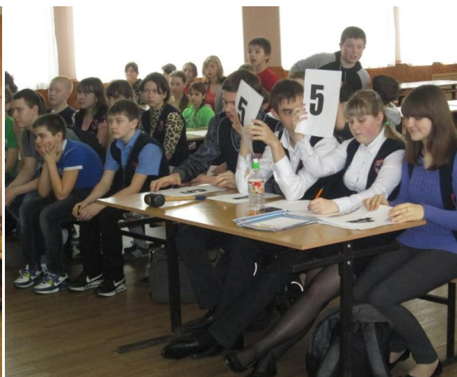
Помощь в организации и проведении школьных мероприятий