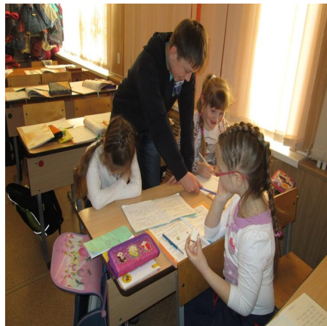
Шефская помощь первоклассникам