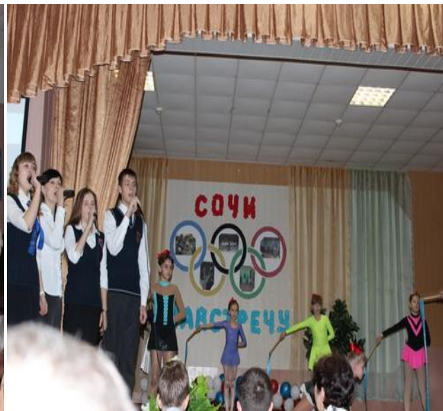
Помощь в проведении общешкольного мероприятия «Навстречу Сочи»