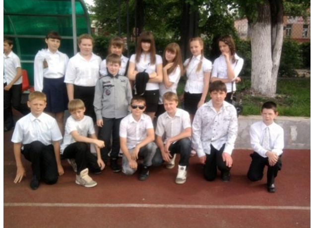
Участие в мероприятиях городского масштаба