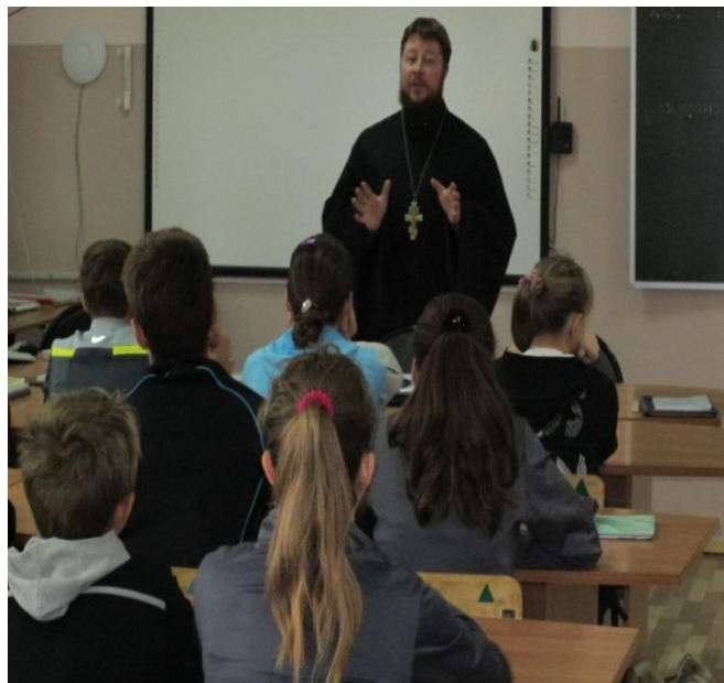
Акция «Белый цветок»