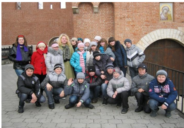
Экскурсия в город-герой Тулу