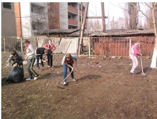
Благоустройство территории школьного двора