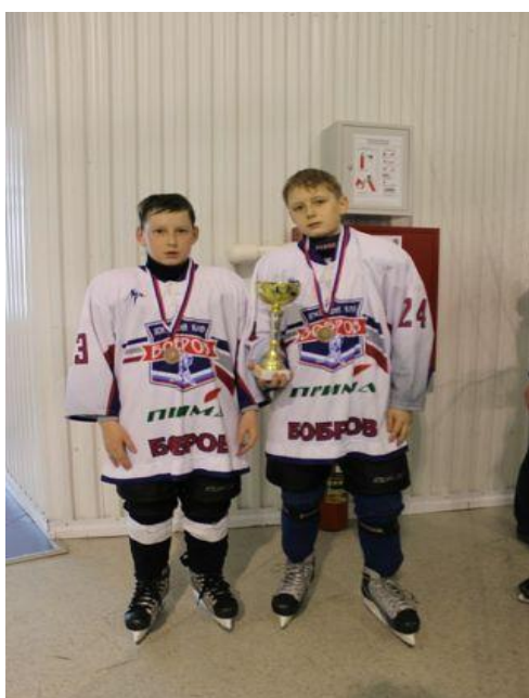
Спорт – это здорово!