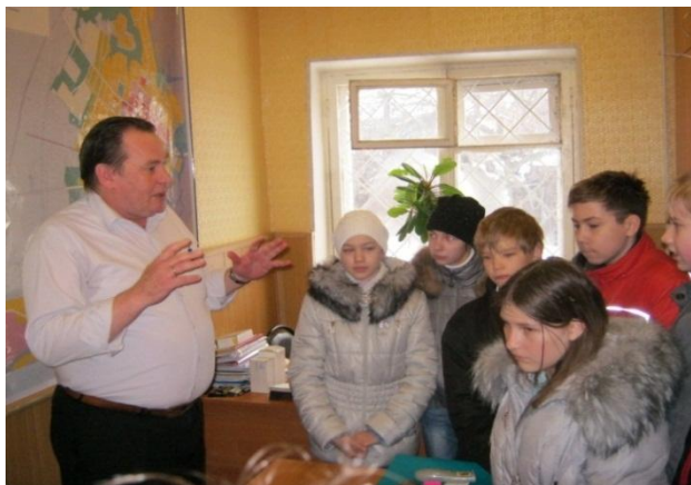
Беседа с директором ООО «Водока- нал» г.Бобров