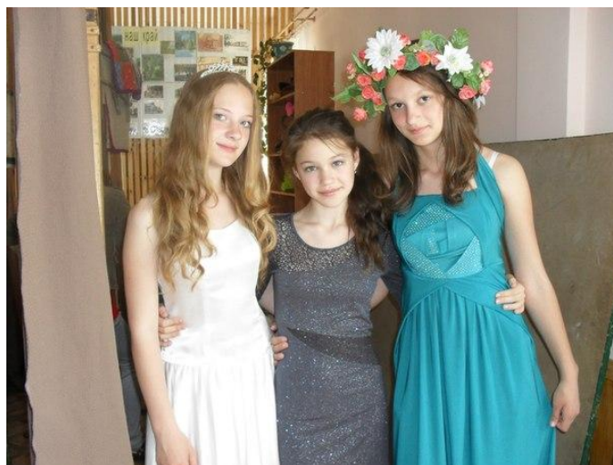
Помощь в организации праздника в детском садике